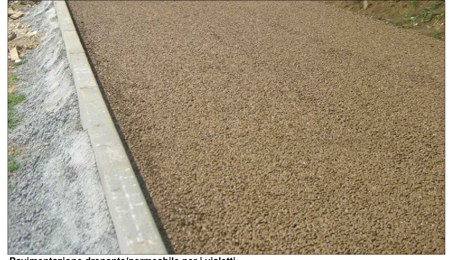
Pavimentazione drenante/permeabile per i vialetti