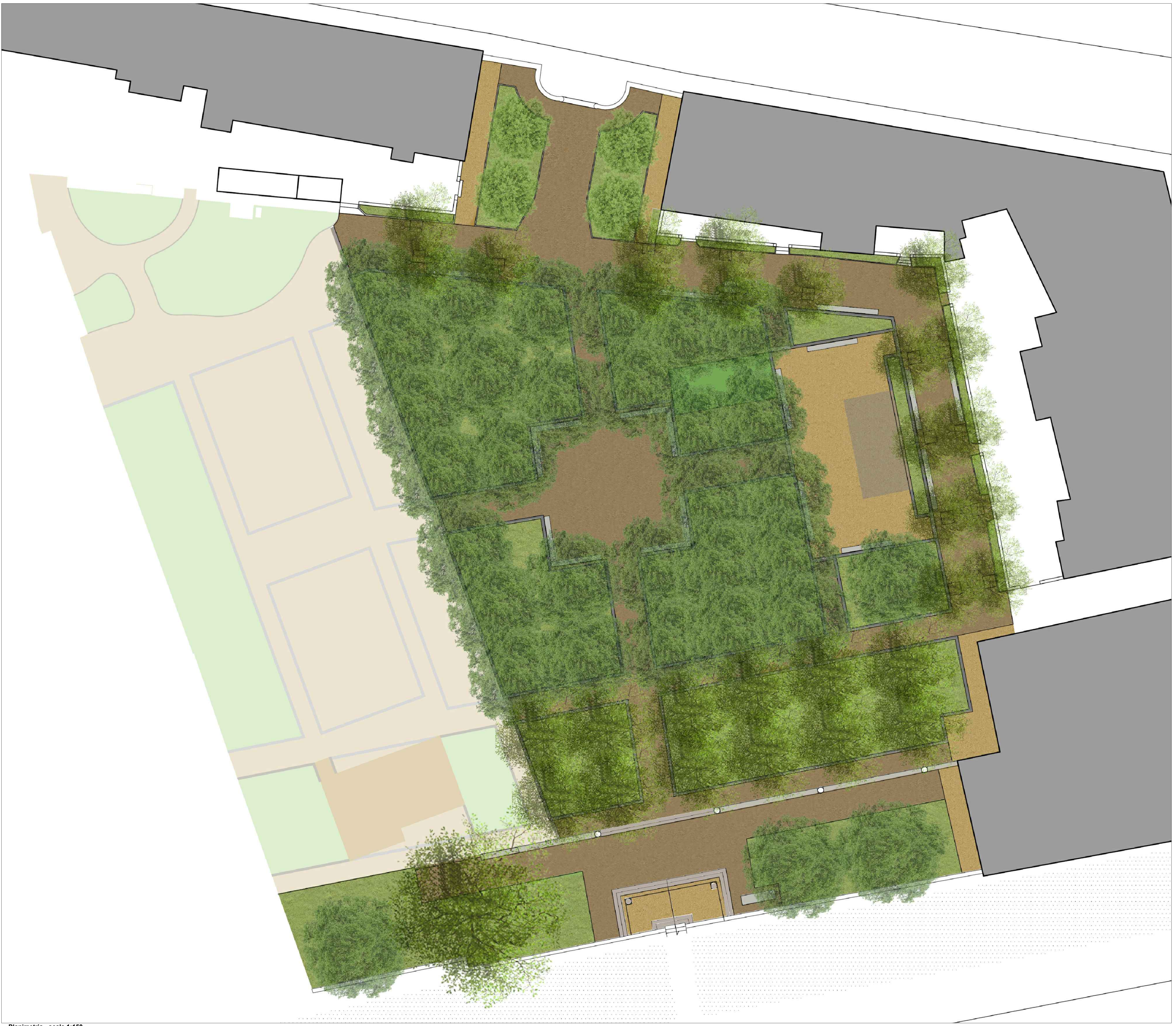
Planimetria - scala 1:150