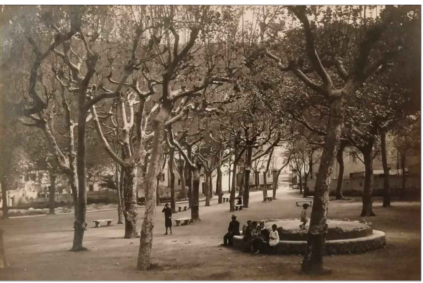
Il parco prima del 1936 - il "Parterre"