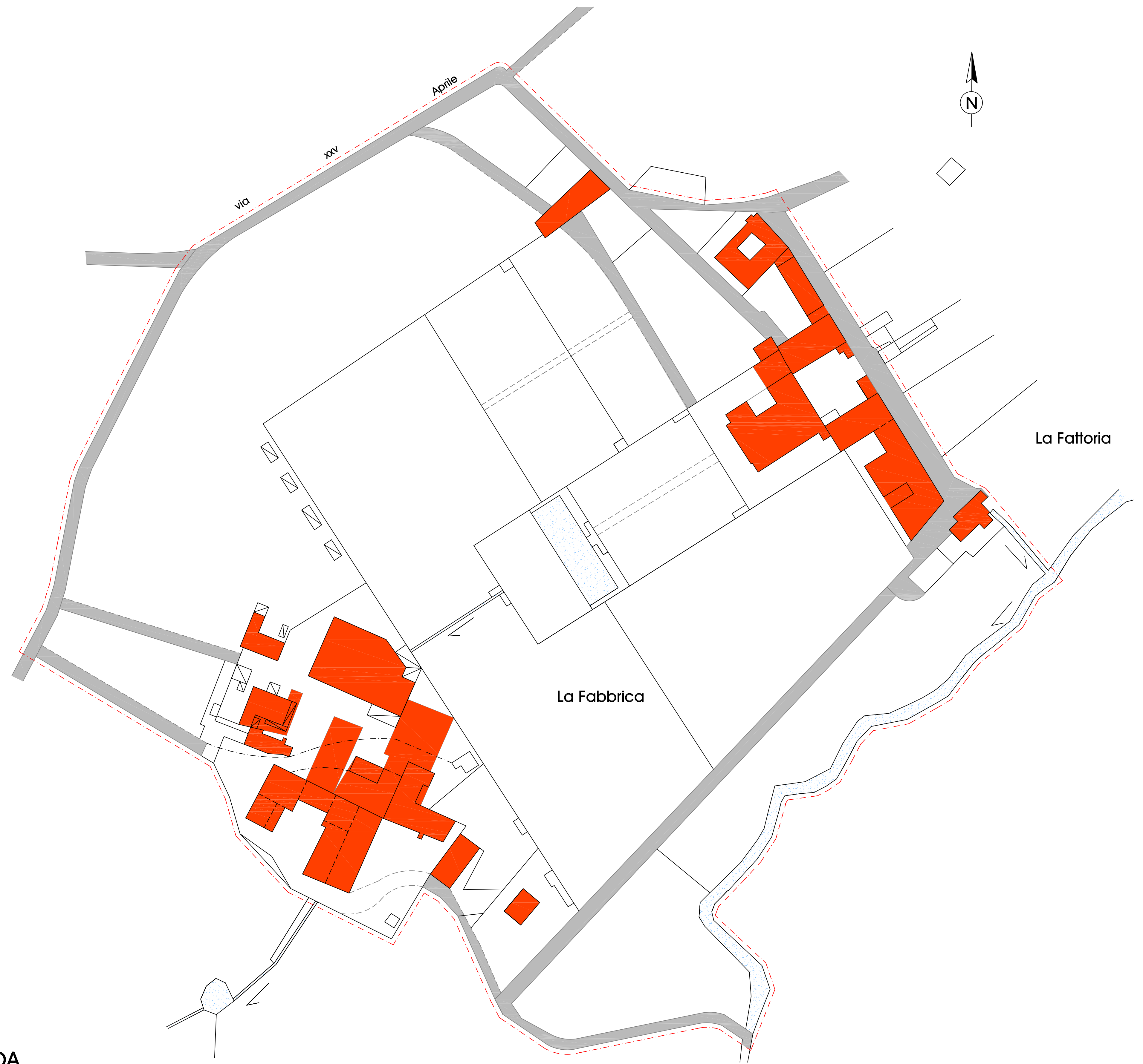
TAVOLA 3/c (A)