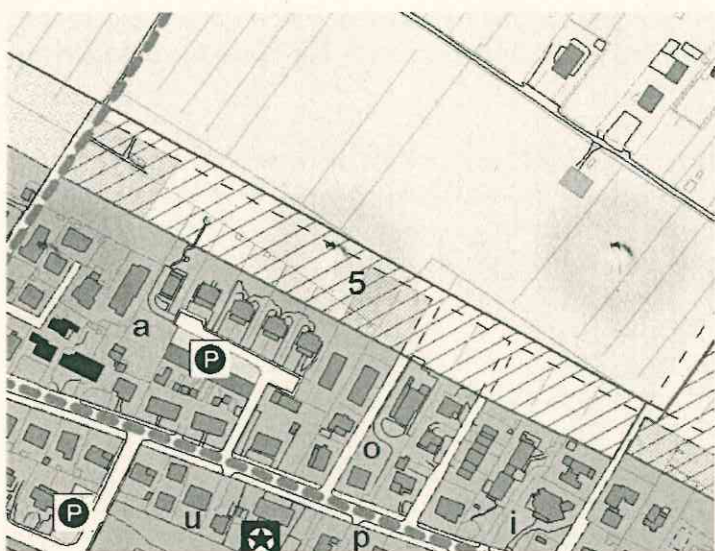
Estratto Regolamento Urbanistico 2000- Variante ai vincoli 2005

Dal punto di vista urbanistico il comparto ha subito diverse variazioni dal Regolamento Urbanistico del 2000 ad oggi. Le fasi principali di modifica del suddetto comparto, si riassumono di seguito sinteticamente: