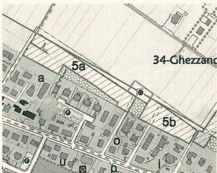
Estratto Regolamento Urbanistico 2012- Variante ai vincoli 2012